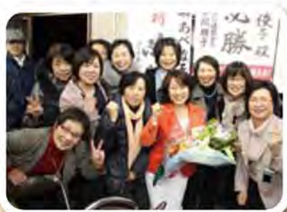
支援者と喜びを分かち合う あべ俊子議員