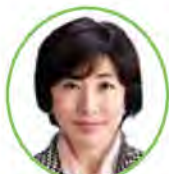
初当選の木村 弥生 衆議院議員