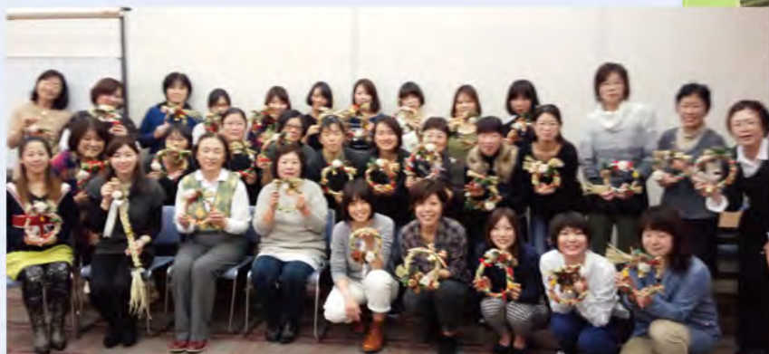
個性的なリースを持ってパチリ