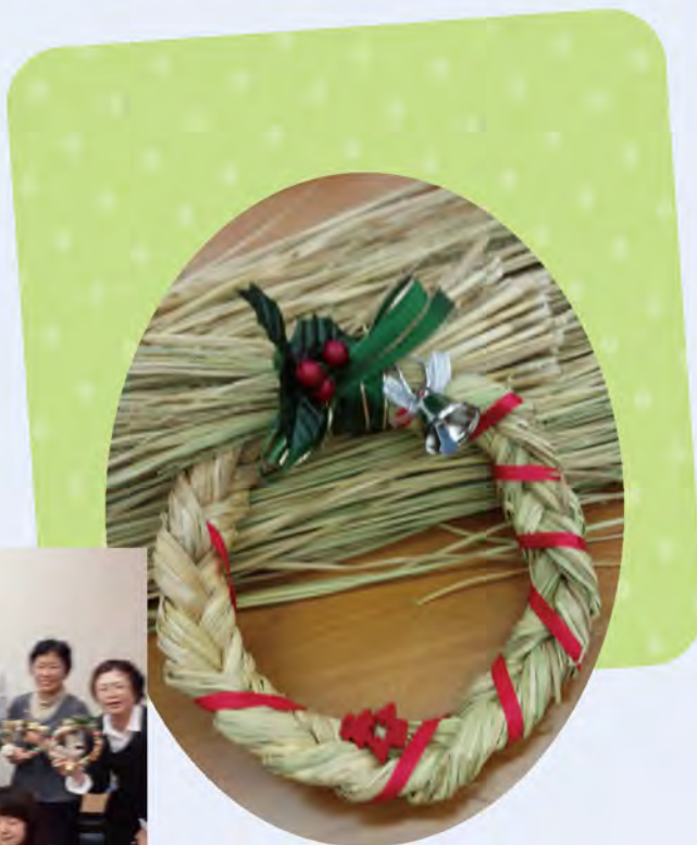
出来上がりました