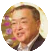
宮沢洋一 参議院議員