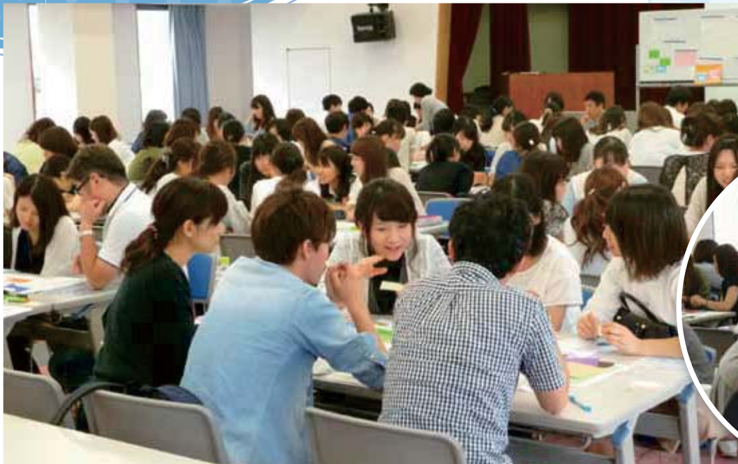
ラベルワークしています