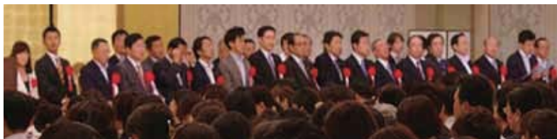
当日のご来賓の皆様

総会は平成 28 年度スローガン・活動計画・予算など 5 つの提出議案が審議され、賛成多数で可決されました。また議事の後に役員交代が行われ、新たに増員となった幹事 2 名を含む 7 名の新役員が選出されました。板谷会長のリーダーシップのもと、次期参院選を見据えた平成 28 年度広島県看護連盟の活動がスタートしました。