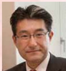
参議院議員 石田 まさひろ

本年も、看護職の誇りを胸に鋭意努力する所存です。皆さまのますますのご繁栄を心よりご祈念申し上げます。