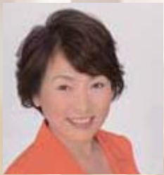
衆議院議員 あべ 俊子

広島県看護連盟の皆さまには、日頃より温かいご支援を賜り、心より感謝申し上げます。昨年は、全国の看護連盟の皆さまの力添えのおかげをもちまして、たかがい恵美子先生が2期目の当選を果たし、国政での看護の議席を堅守できた大変喜ばしい年となりました。