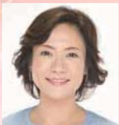
参議院議員 たかがい 恵美子

謹賀新年 丁酉(ひのととり)の2017年は、直感力と行動力を磨いて運氣を取り込み「いのち(人生)