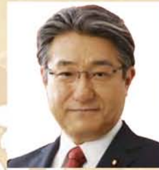
参議院議員 石田 まさひろ

これからますます本格的となる超高齢社会を支えるためには、看護職の皆様の大きな力が必要です。今年は診療報酬・介護報酬のダブル改定を控えており、現場にもさまざまなかたちでの影響が及ぶと思われます。看護職の活躍の場も年々多様に拡がっておりますので、それら現場の声をお聞かせいただき、看護職の皆さんお一人お一人が働きやすく、やりがいをもって看護できるようしっかりと国政で声をあげてまいります。本年もどうぞよろしくお願いいたします。