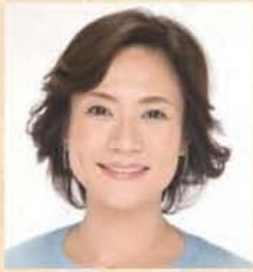
参議院議員 たかがい 恵美子