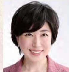
衆議院議員 木村 やよい

看護職のみなさまが「今日も良い看護ができた!」と実感できるよう、共に手を携え活動してまいりますので、引き続きよろしくお願い申し上げます。