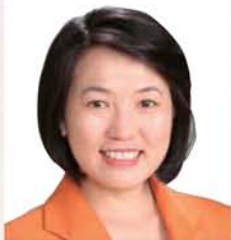
衆議院議員 あべ 俊子

皆々様の温かいお支えに改めて心から感謝を申し上げ、また皆様にとりまして健やかな笑顔あふれるよき年となりますことを、重ねてご祈念申し上げます。