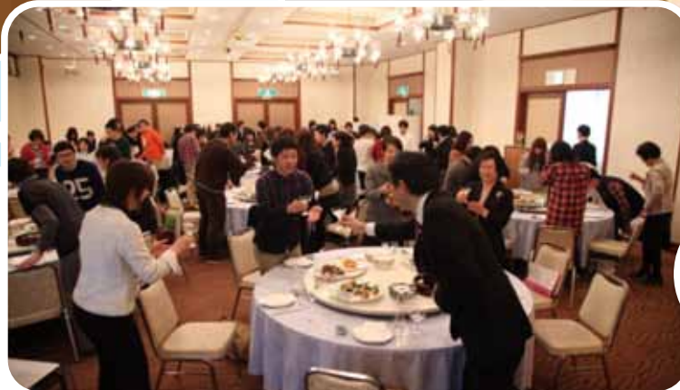
ランチョンセミナー