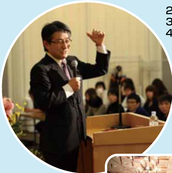
石田まさひろ議員の講演