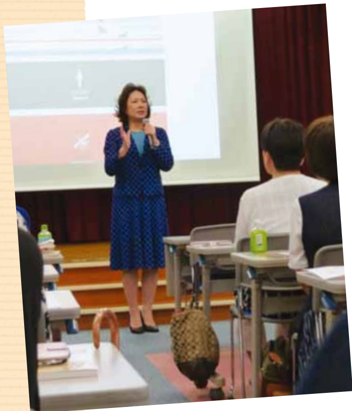
参議院議員 たかがい恵美子先生も サプライズで登場!