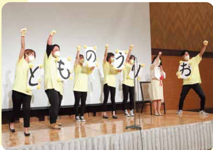
青年部の応援コール