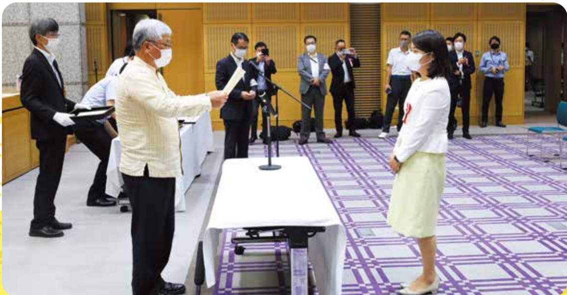
当選証書と議員バッジを授与されました